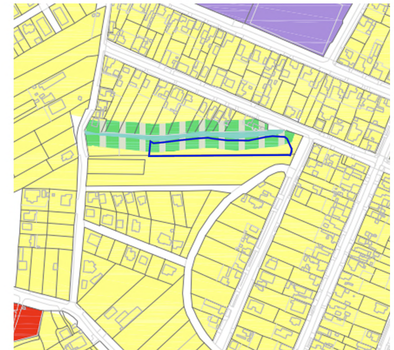
Incadrare in teritoriu - extras PUG 2023 mun. Timișoara