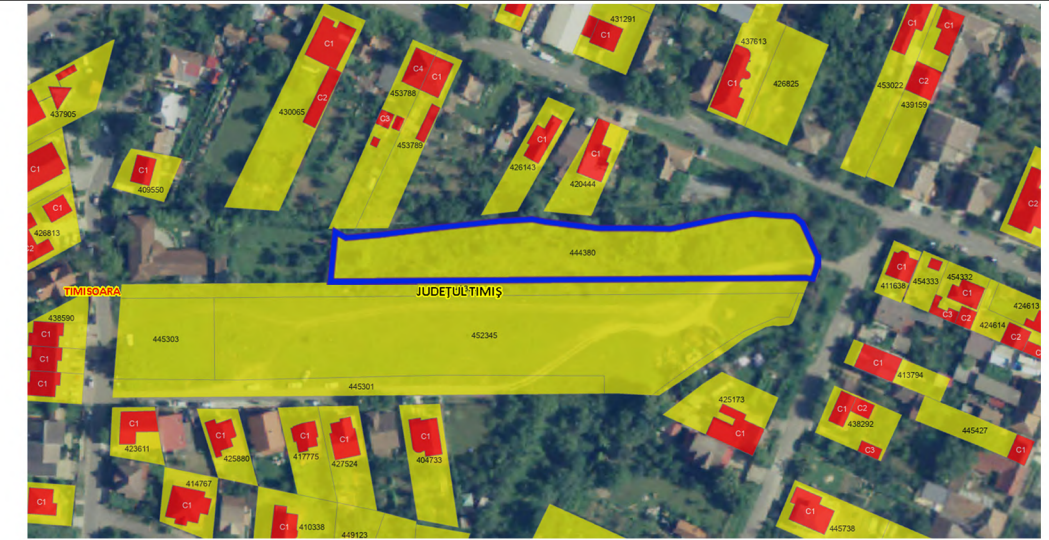
Incadrare in teritoriu - extras baza de date ANCP