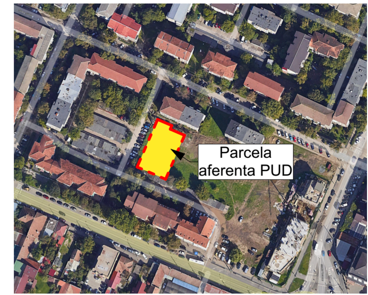
Parcela aferenta PUD