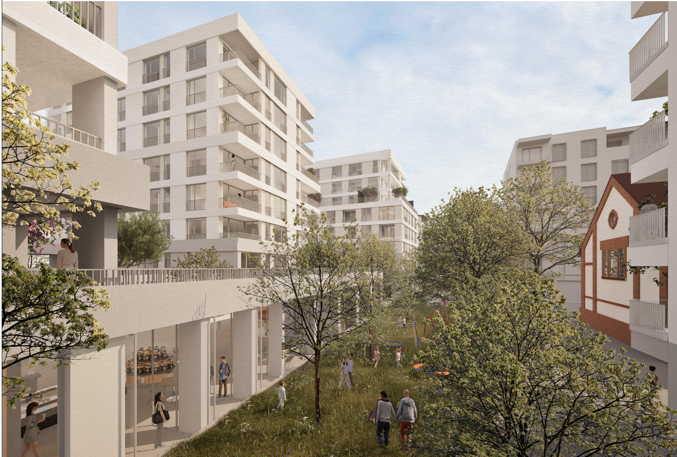
PERSPECTIVĂ CURTE ÎNVERZITĂ

© Acest document este proprietatea firmei s.c. planwerk arhitectură și urbanism s.r.l. și nu poate fi folosit, transmis sau reprodus, total sau parțial, fără autorizație expresă și scrisă. Utilizarea sa trebuie să fie conform celei pentru care a fost elaborat. Documentul este valabil numai cu semnăturile și ștampilele în original.