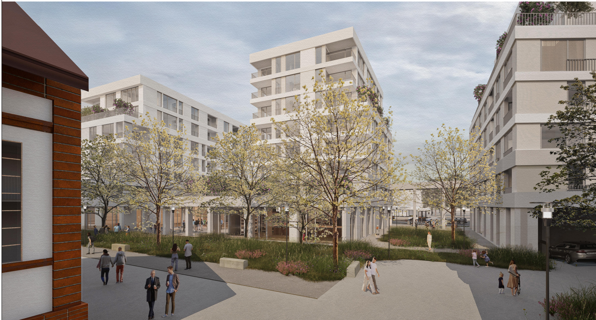
PERSPECTIVĂ ÎNSPRE BULEVARDUL REPUBLICII Ilustrare a ansamblului propus, dinspre sud. Imobilul beneficiază de o curte înverzită.

© Acest document este proprietatea firmei s.c. planwerk arhitectură și urbanism s.r.l. și nu poate fi folosit, transmis sau reprodus, total sau parțial, fără autorizație expresă și scrisă. Utilizarea sa trebuie să fie conform celei pentru care a fost elaborat. Documentul este valabil numai cu semnăturile și ștampilele în original.