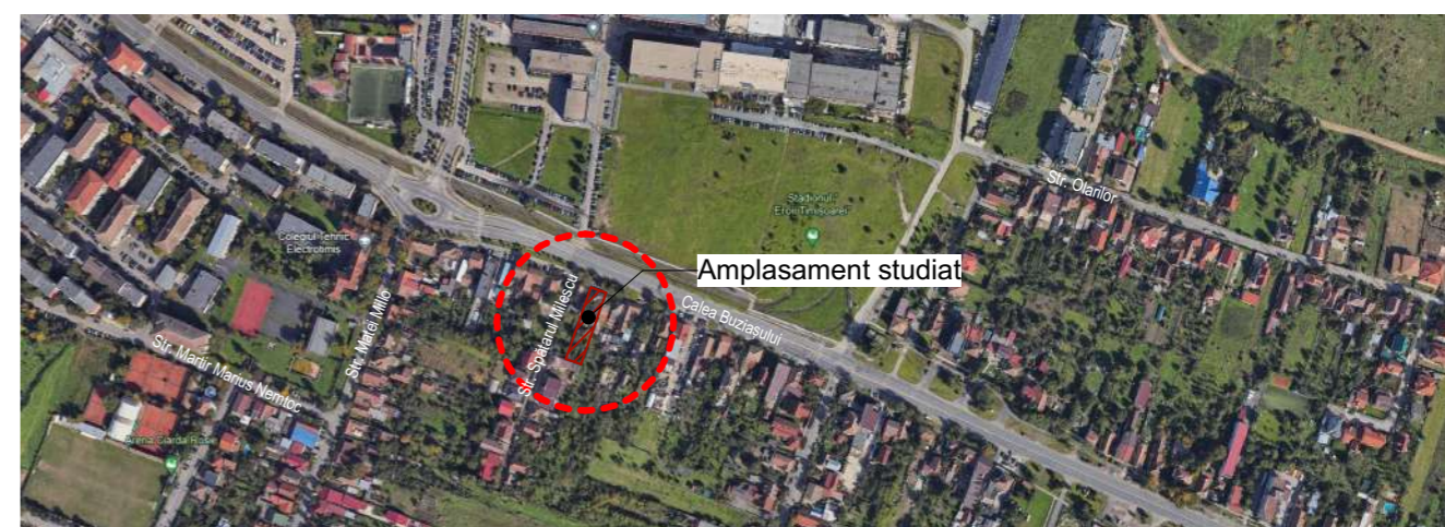
Încadrare în localitate