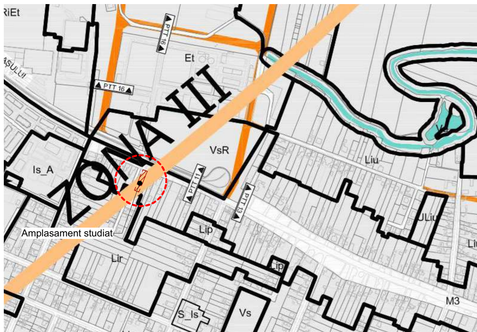
Încadrare în localitate