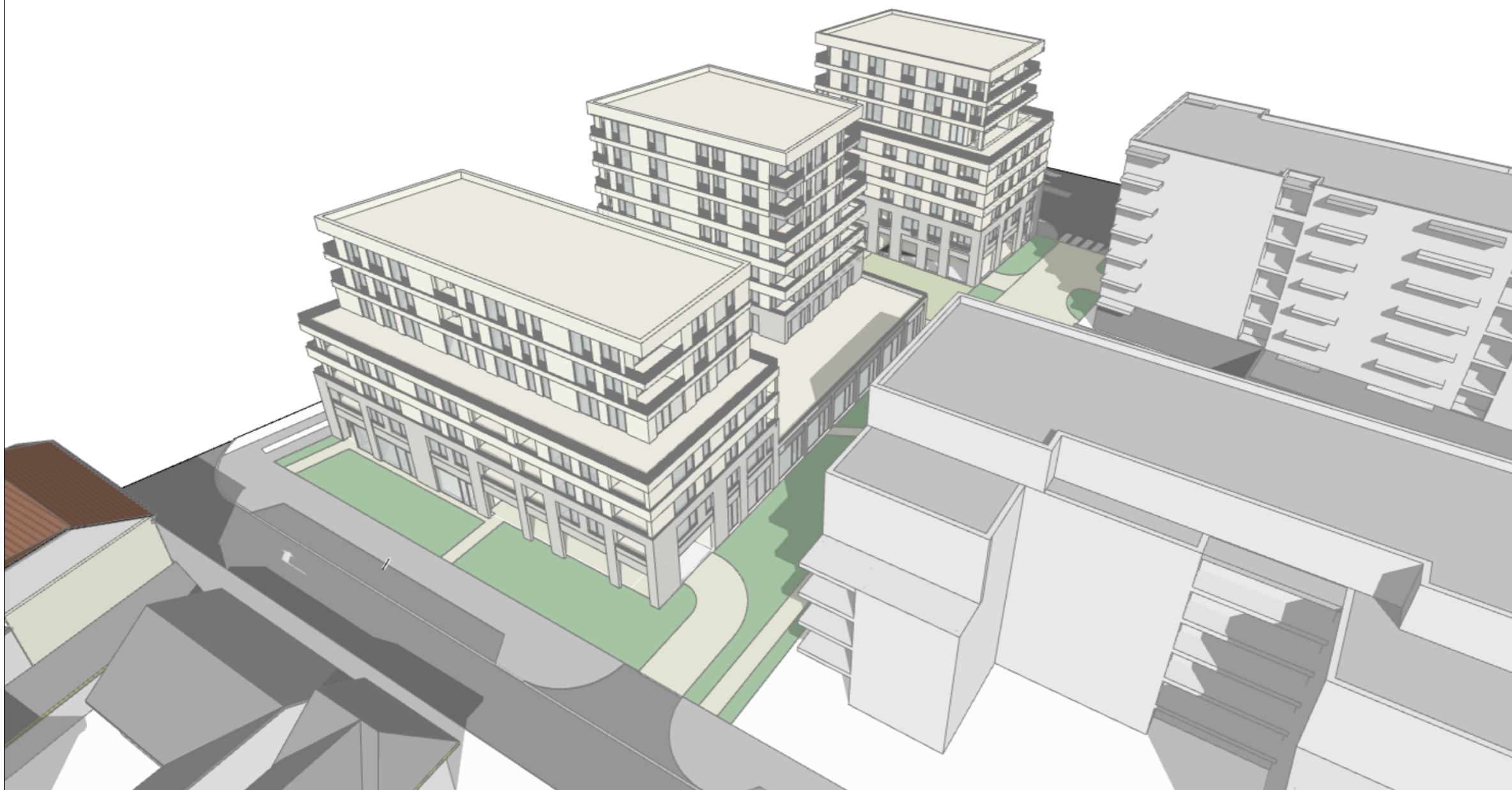
PERSPECTIVĂ AERIANĂ DINSPRE STR. ANTON SEILLER

© Acest document este proprietatea firmei s.c. planwerk arhitectură și urbanism s.r.l. și nu poate fi folosit, transmis sau reprodus, total sau parțial, fără autorizație expresă și scrisă. Utilizarea sa trebuie să fie conform celei pentru care a fost elaborat. Documentul este valabil numai cu semnăturile și ștampilele în original.