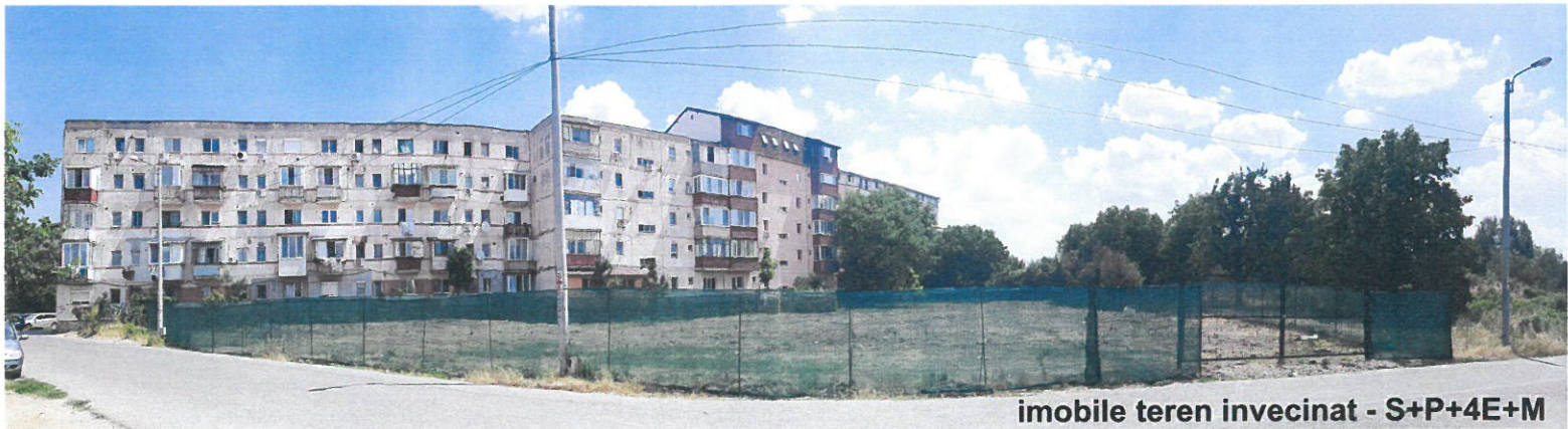
imobile teren invencinat - S+P+4E+M