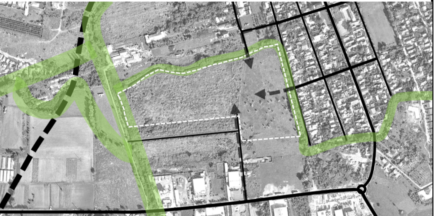
Perdelele verzi de-a lungul canalelor de desecare (coridoarele verzi-albastre) ca limite între unitățile teritoriale de referință, și accesul posibil pe parcelele studiate.