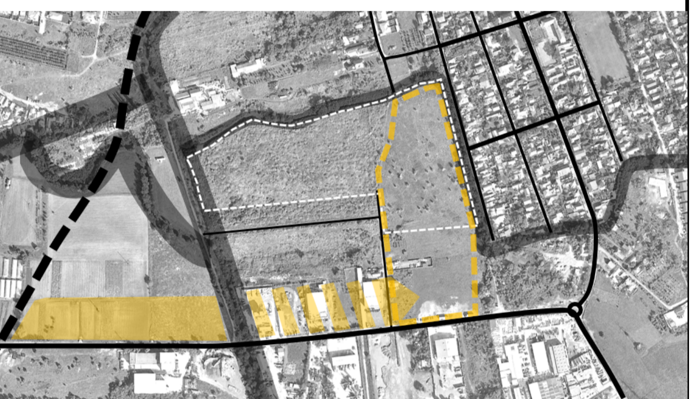
Propunere de modificare a reglementărilor de la nord de Calea Moșniței după revizuirea PUG