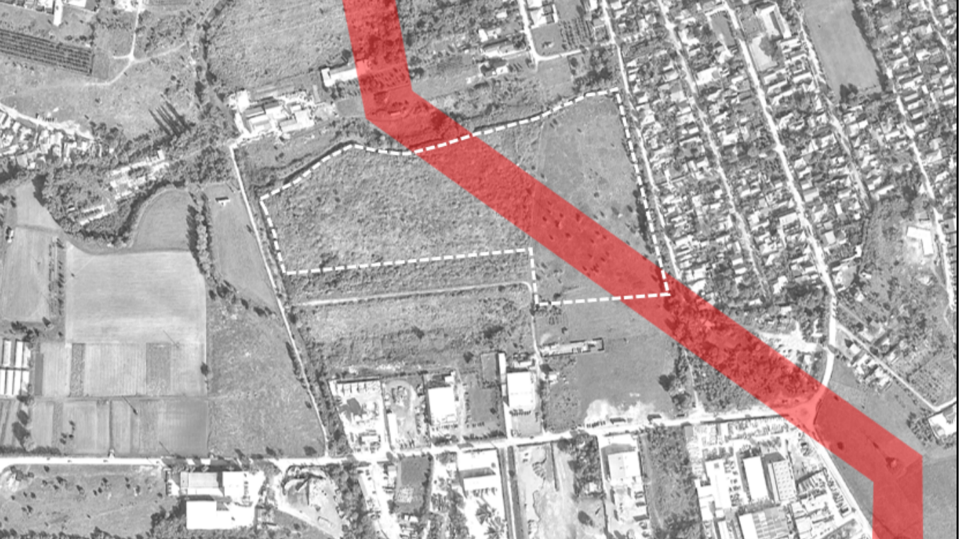
Disfuncționalitate majoră - zonă de protecție LEA 110kVA