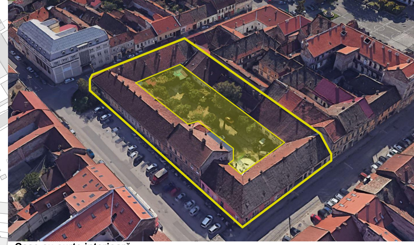
Case cu curte interioară exemplu: Str. Dacilor nr.8

Acest document se parcurge împreună cu întreaga documentație din proiect, de exemplu alte planșe, fișele UTR, memoriu și RLU. Planșele au fost elaborate pe baza ridicării topografice a spațiului public realizate în cadrul proiectului, a datelor cadastrale, OCPI disponibile la nivelul lunii Iulie 2025, precum și a unor surse auxiliare de informație: ortofotoplanuri, observații de teren, documentații urbanistice și materiale istorice disponibile. Informațiile provenite din surse auxiliare au caracter orientativ și au fost utilizate pentru completarea analizei, fiind necesară verificarea lor punctuală, după caz. Documentația se bazează pe datele Etapei 1- Studii de Fundamentare. Observațiile legate de document vor fi raportate către Subcontrol srl.