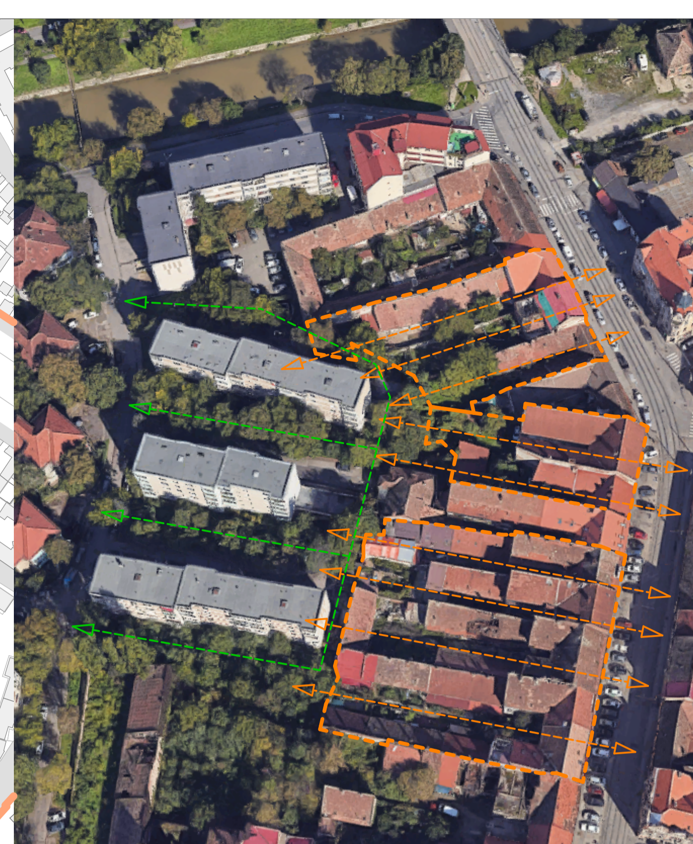
Case dublu front propuse Str. Dacilor nr. 1-21