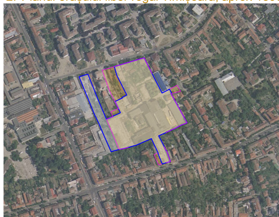
5. Harta cu incinta Tehnolemn perioada 1975-2005