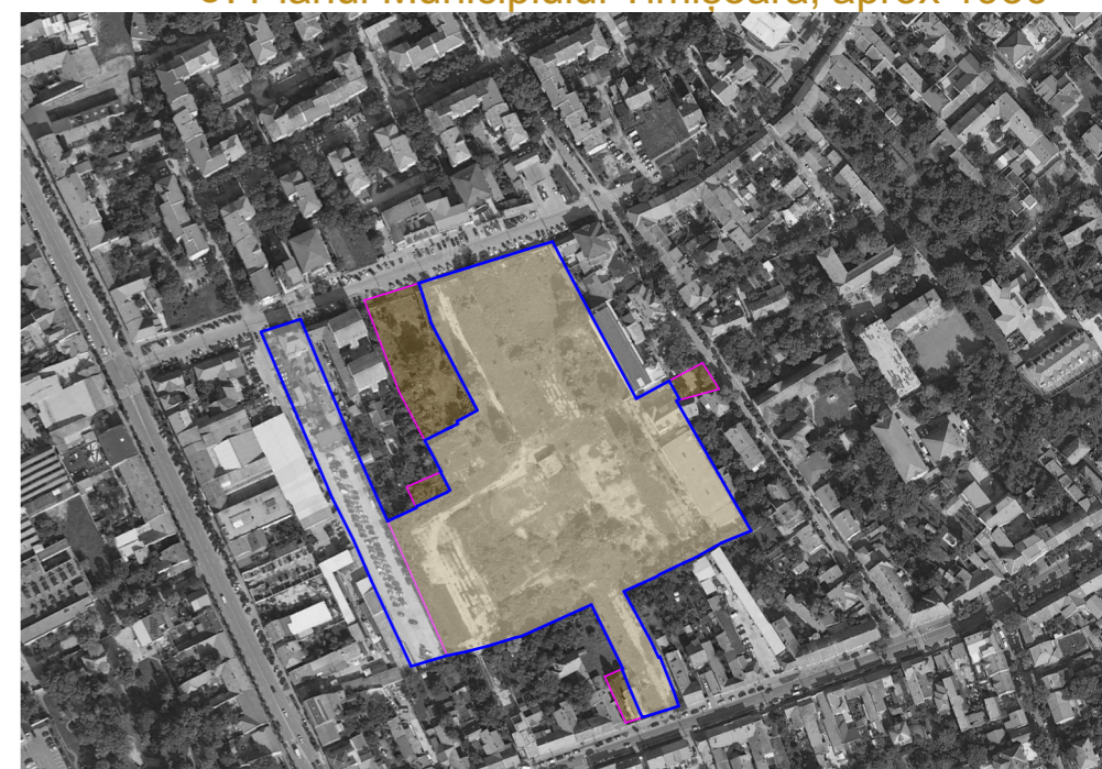
6. Extras google earth 2025

Din punctul de vedere al evoluției istorice a orașului Timișoara se remarcă faptul că terenul studiat face parte din Cartierul Elisabetin, care a luat ființă imediat după plecarea turcilor, între 1716 și 1718, și purta numele de „Maierele Vechi” (germană Mayerhof).