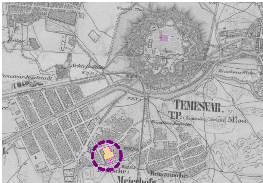
1. Harta Timișoara 1819-1869