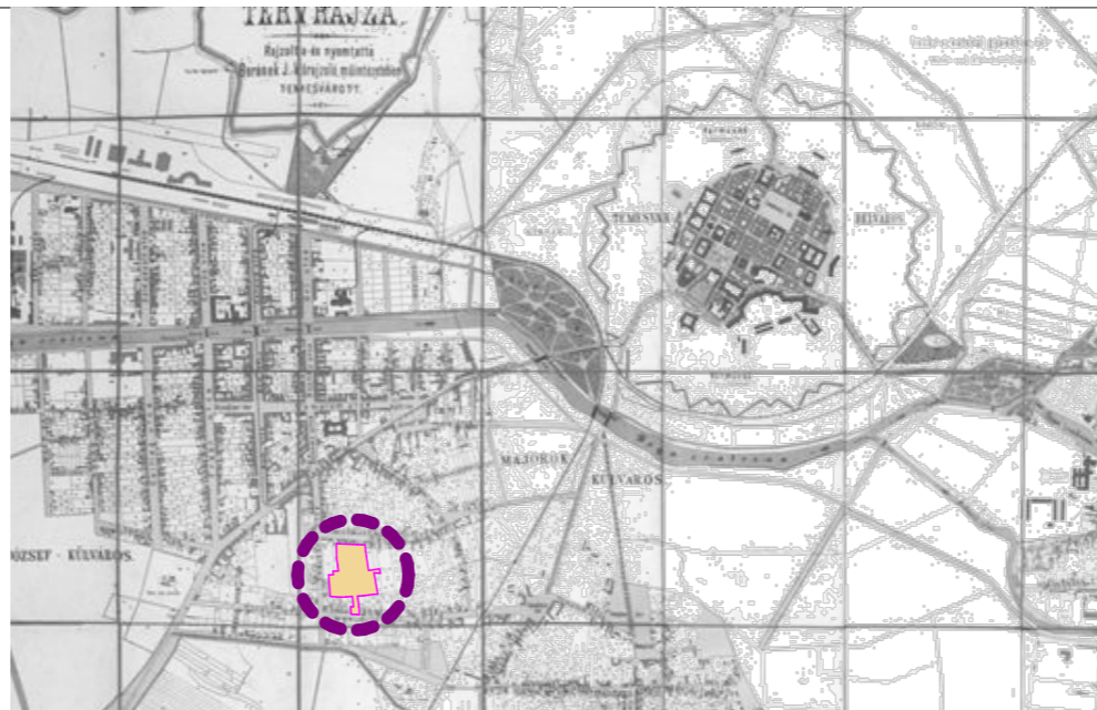
2. Planul orașului liber regal Timișoara, aprox 1890