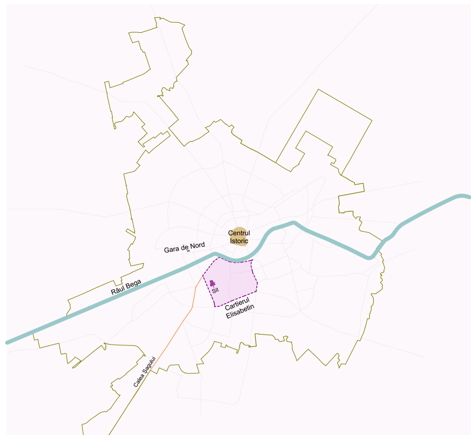
Harta Timișoara - încadrare