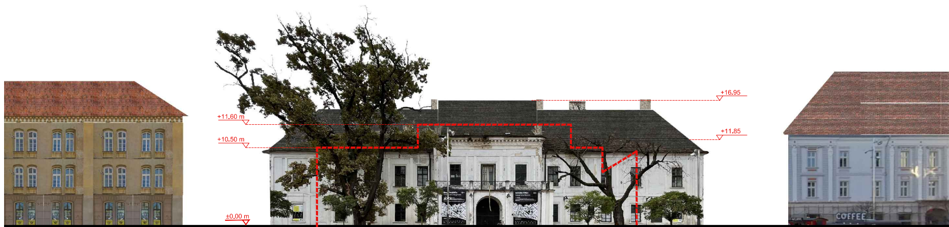
DESFĂȘURATĂ PIAȚA LIBERTĂȚII