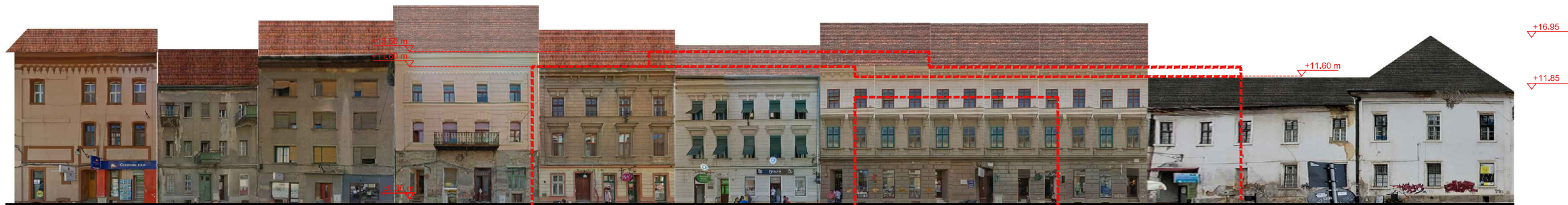
DESFĂȘURATĂ STR. LUCIAN BLAGA